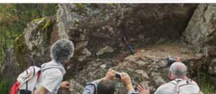
Fotografiando huellas fósiles