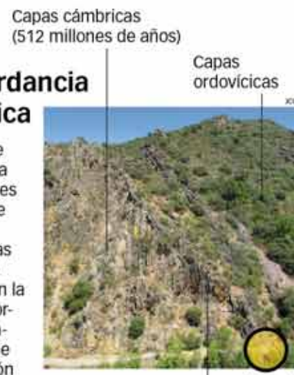
Usted está aquí Discordancia Toledánica

En el lenguaje geológico, una discordancia es una superficie que pone en contacto rocas con diferente inclinación. En la llamada discordancia Toledánica, que tiene en el Boquerón una de las mejores representaciones de Europa, las capas cámbricas se plegaron y erosionaron antes de la sedimentación del Ordovícico Inferior (478 millones de años).